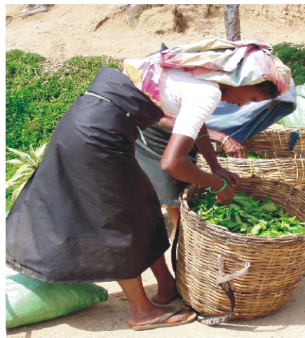
KUBEBA CHAI, KITABU CHA PICHA, PICHA NA. 51